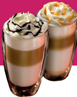
dunkler & heller Leonardo