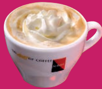
Cappuccino mit Sahne