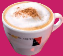
Cappuccino mit Milchschaum