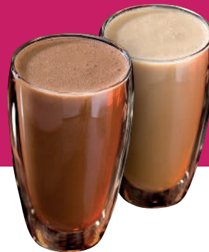
dunkler & heller Iced Leonardo